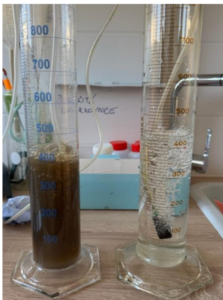
3) Odmerné valce pri aerácii.