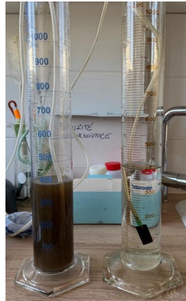
2) Dosierzylinder vor der Belüftung.