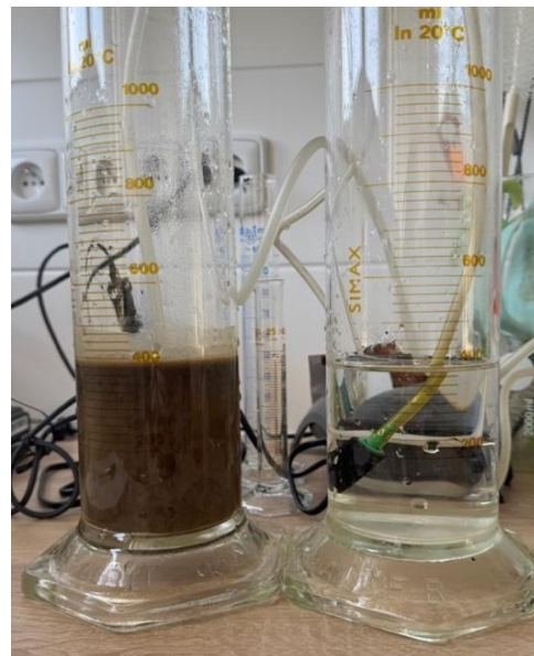
2) Zustand vor Belüftung und Farbstoffauftrag.