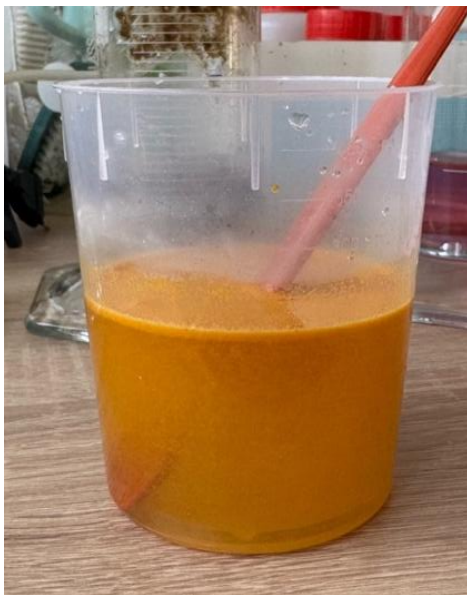
1) Vorbereitete Kurkumalösung.