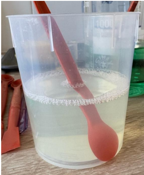
1) Vorbereitete Federlösung.